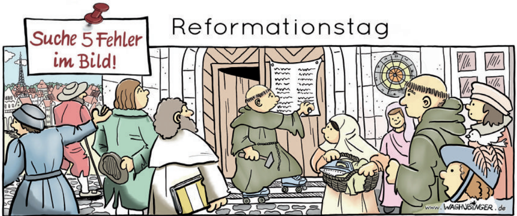
Eiffelturm, Rollschuhe, Bügelleisen, Dartscheibe, Vogel auf dem Hut

Bei Interesse bitte Anmeldung im Gemeindebüro (Tel. 02403 65265).